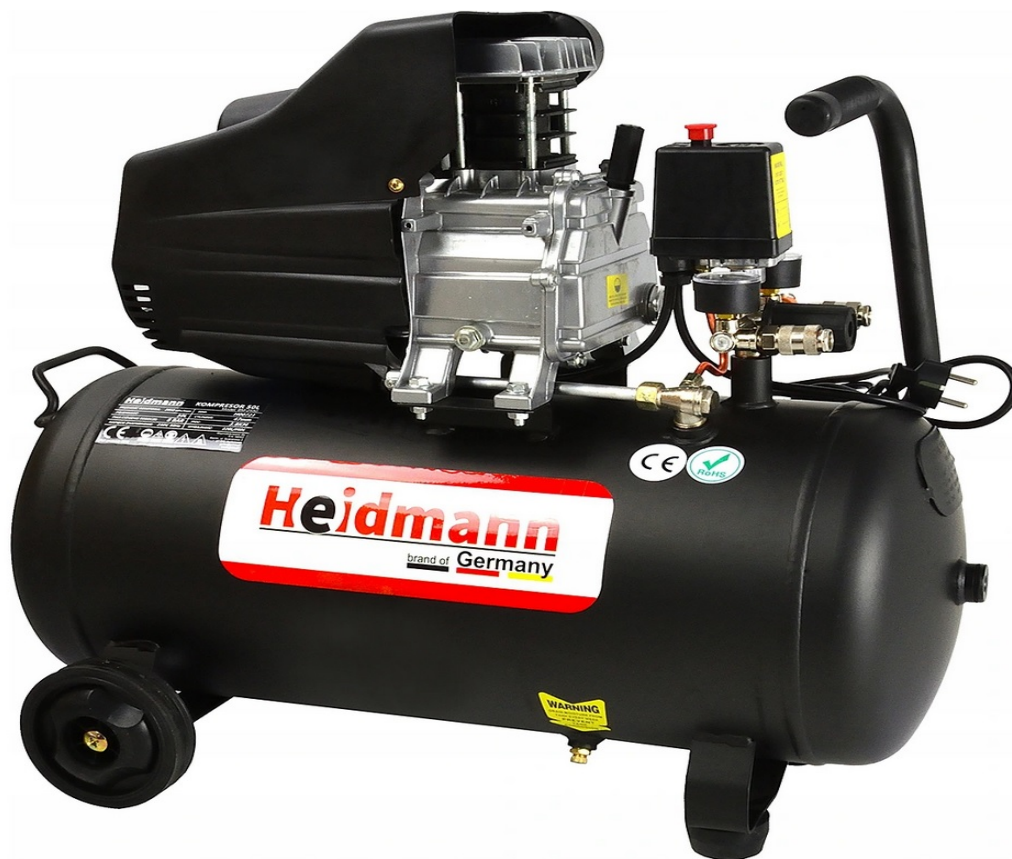
МАСЛЕН КОМПРЕСОР 50L 8bar HEIDMANN H00721

СЪВРЕМЕНЕН компресор има висока мощност и въздушен капацитет, увеличен до 220l / min , поради което се използва в домашни работилници и в професионални автомобилни сервиси за обслужване на пневматични устройства.