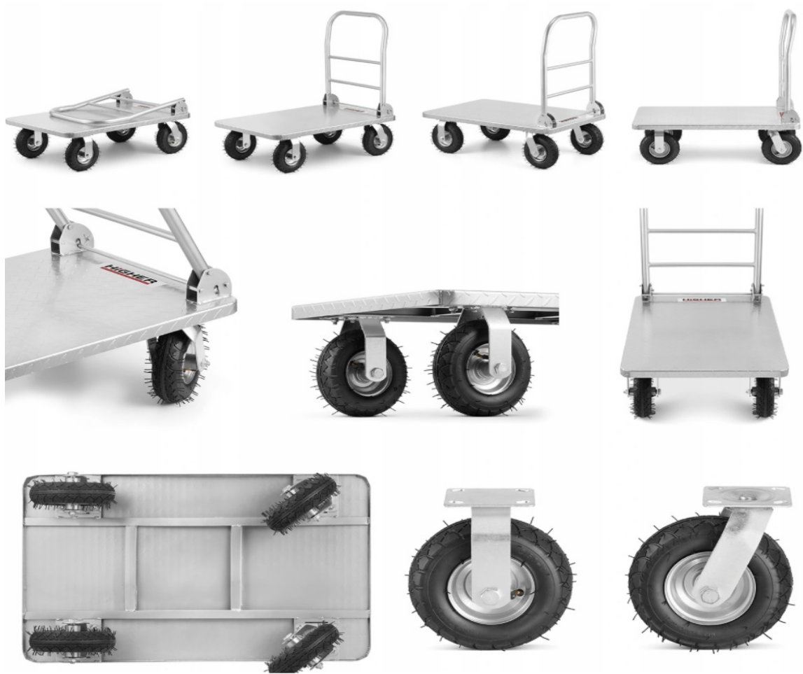
Платформена количка - оборудване